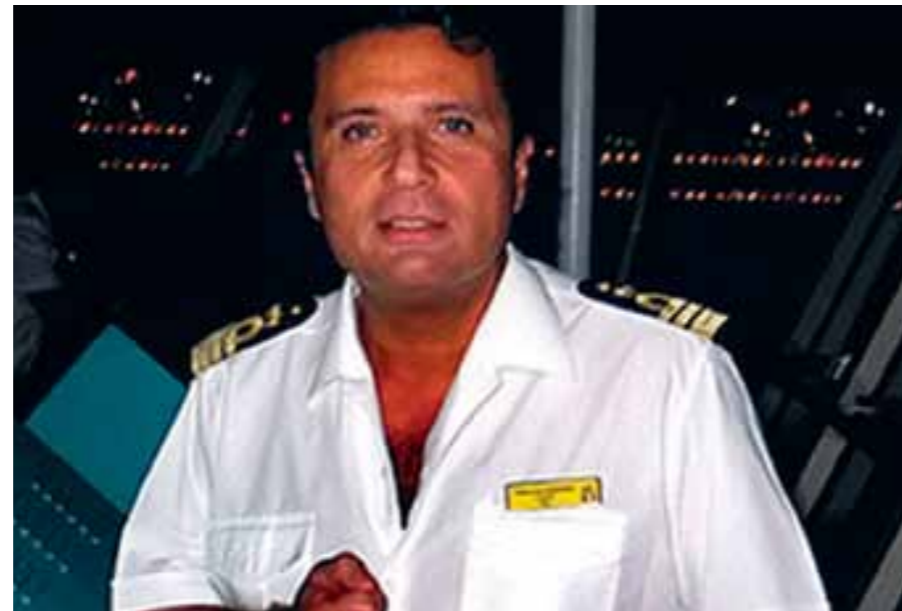
Kapitein Francesco Schettino